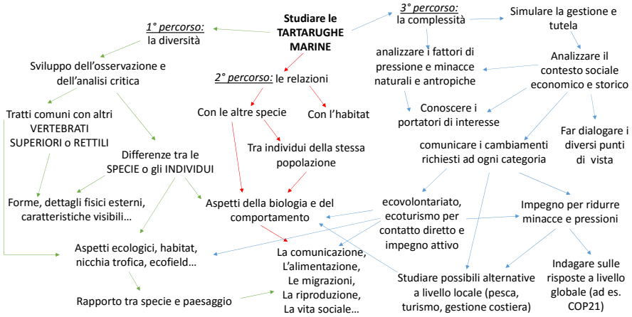
Fig. 3 - Mappa concettuale per un progetto didattico multidisciplinare